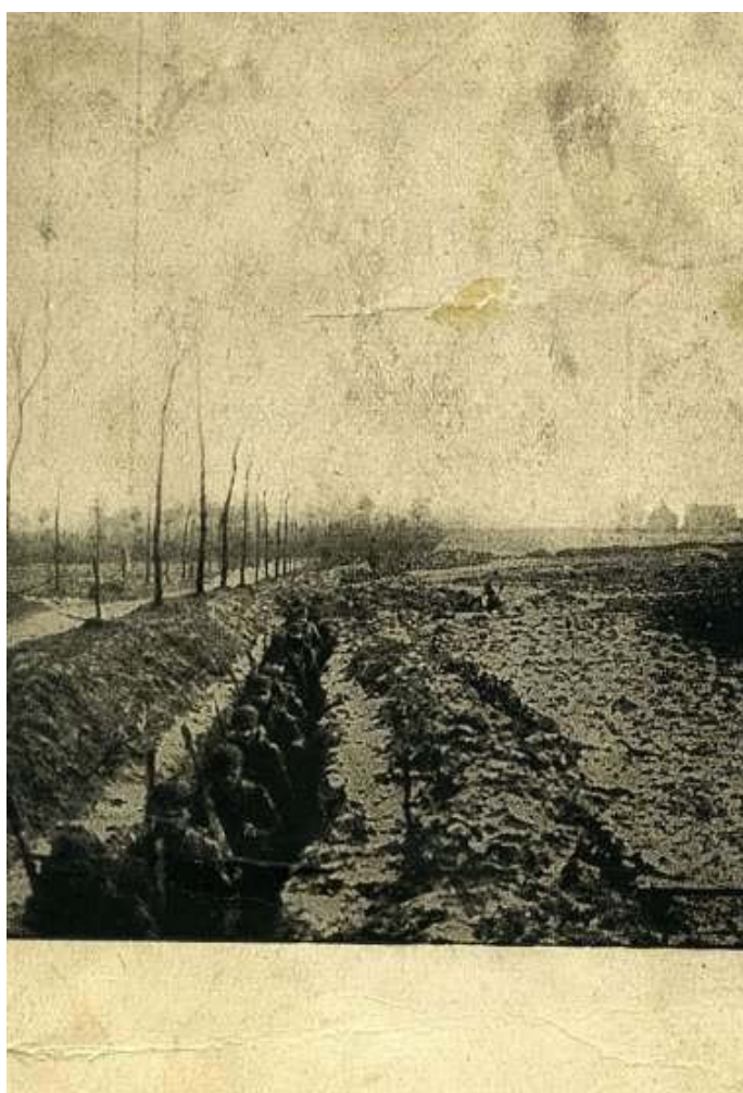
Soldater i skyttegrav

Historien viser os, at der i krige sker grusomme overgreb, som ofte ikke var en del af de krigsførende parters oprindelige planer for krigens forløb. Overgrebene sker ofte ikke alene på de kæmpende soldater, men også i høj grad på uskyldige civile der bliver fanget i kampzonerne. I forbindelse med Danmarks krigsførelse i Afghanistan og Irak har nyhedsmedierne berettet om flere tilfælde hvor vestlige tropper enten har udleveret fanger til tortur og henrettelse, eller endog selv har begået overgrebene. Hvor mange civile irakere og afghanere der er døde som følge af kamphandlinger hvor de bor, er dog ikke noget der berettes om i pressen. Kun de færreste kender ikke de skræmmende fotografier fra Iraks Abu Ghraib fængsel, hvor de amerikanske troppers adfærd overfor irakiske fanger vidnede om krigens forrående effekt på soldaterne. 1 Eller scenerne i den danske dokumentarfilm Armadillo, hvor unge danske soldater er i kamp mod en ikke-uniformeret fjende der gang på gang angriber og derefter forsvinder blandt civilbefolkningen. Dokumentarfilmen vakte debat, blandt andet på grund af soldaternes forråede adfærd og sprogbrug. Ord som