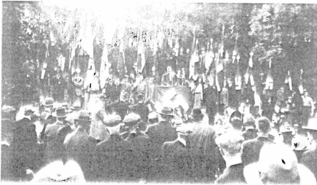
Frits Clausen taler på et partimøde på Sjælland, formentlig landsstævnet i Slagelse i 1938. Omkring talerstolen er der opstillet fanevagt med hagekorsfaner.