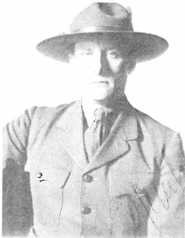
Cay Lembcke var kendt som medstifter af spejderbevægelsen i Danmark. Han stillede ved folketingsvalget i 1924 op for Det radikale Venstre i Østre Storkreds, men gled hastigt ud på den alleryderste højrefløj. Lembcke stiftede i 1930 DNSAP, hvis første fører han blev.

forholdene i Sønderjylland. Mødet endte i tumult, og både Cay Lembcke og Frits Clausen søgte ly i en nærliggende restaurant. De to faldt i snak, og Frits Clausen indbød med den for ham sædvanlige, store armbevægelse Cay Lembcke til at bo hos sig i Bovrup under resten af sin fore-