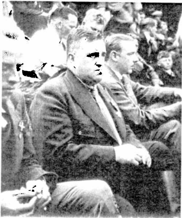
Frits Clausen med cigaret. I modsætning til den asketiske tyske Führer nød Frits Clausen både tobak og spiritus. Han ses her på tilskuerpladserne til et partimøde på Sjælland, formentlig landsstævnet i Slagelse 1938.