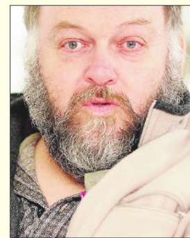
H.E. Sørensen er forfatter og bor i Skærbæk.

Den originale Istedløve er endelig tilbage på sin rette plads. Ville det så ikke være en ide - og en slags historisk kontinuitet, hvis de to hovedstæder, hvor den har opholdt sig i henholdsvis 81 og 66 år, hver havde en kopi?