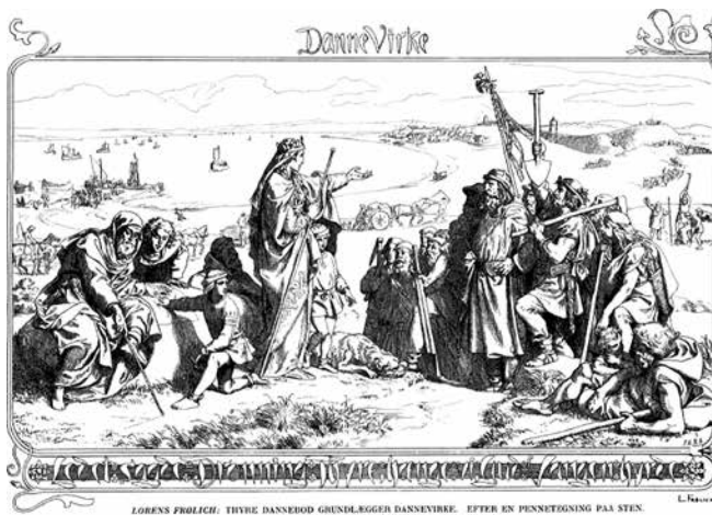
Maleren Lorenz Frølich fremstillede i 1855 Thyra Danebod, Gorm den Gamles dronning, som bygherre til Dannevirke. Ifølge Saxo var det Thyra, der tog initiativet til at opføre Dannevirke for at forsvare landet mod fjender fra syd. Arkæologiske undersøgelser har dog vist, at opførelsen af Dannevirke blev påbegyndt 300 år før Dronning Thyra.