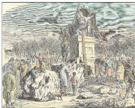
Nedrivningen af Istedløven på den gamle kirkegård i Flensborg i 1864 (litografi).