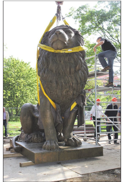
Løvens ankomst til Flensborg i august i år.