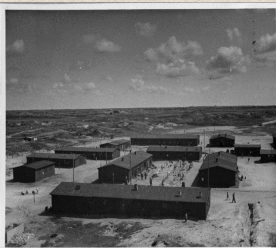
Flygtningelejren Blaavand - et af de mest trøstløse steder

I 1945-46 byggede man et antal baraklejre bestående af barakker købt i Sverige. Det var uisolerede træbarakker, som ellers blev brugt til at huse skovhuggere. Der blev opbygget flere store lejre, hvor flygtningene blev samlet. Den største var Oksbøl-lejren i Vestjylland, der kunne huse op til 36.000 personer. En række materiale blev givet eller indkøbt fra Sverige. Ud over byggematerialer købte man også bl.a. 127.000 knive og 118.000 gafler, 65.000 uldtæpper og 886.000 papirsmadrasser og soveposer. En del tøj og andre fornødenheder blev også doneret fra religiøse grupper bl.a. i USA.