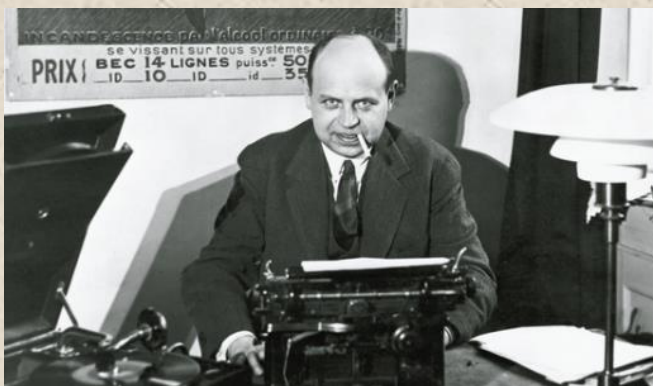
Poul Henningsen ved på kontor

PH står for Poul Henningsen ( 1894-1967 ) , som var en kendt dansk arkitekt, kritiker, samfundsdebattør og forfatter. PH skrev som forfatter en række viser, bl.a. "Man binder os på mund og hånd" der indirekte opfordrede til modstand mod den tyske besættelsesmagt. I 1943 flygtede han til Sverige, hvorfra han kom tilbage efter krigen. PHs synspunkter om bl.a. synet på de tyske flygtninge, fremførte han, selv om de isolerede ham fra hans tidligere forbundsfæller der havde været aktive i modstandskampen.