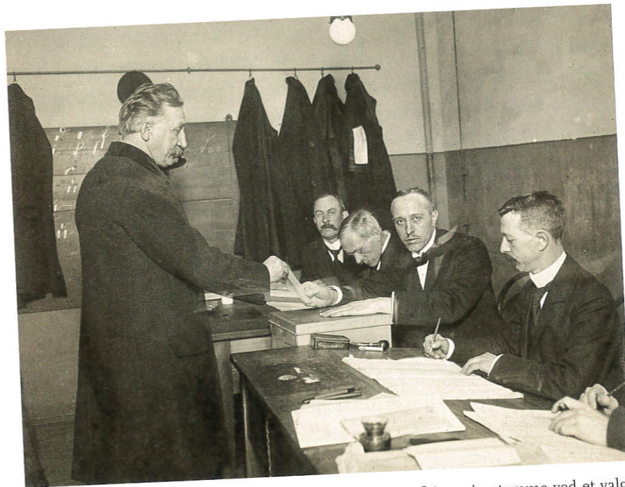
Det danske mindretals leder, redaktør H.P. Hanssen, afgiver sin stemme ved et valg, mens Sønderjylland endnu var under tysk styre. Hans Peter Hanssen (1862-1936) var redaktør af Aabenraaavisen Hejmdal. I årene 1906-19 repræsenterede han mindretallet i den tyske rigsdag, og 1919-20 varetog han som minister for Sønderjylland i den radikale Zahle-regering landsdelens interesser i forhold til Danmark i afstemningsperioden.

Det var de naturligvis stærkt utilfredse med, og de klagede deres nød til de danske sønderjyders leder, redaktør H.P. Hanssen, som også var medlem af den tyske rigsdag. Efter pres fra ham ændrede den danske regering holdning