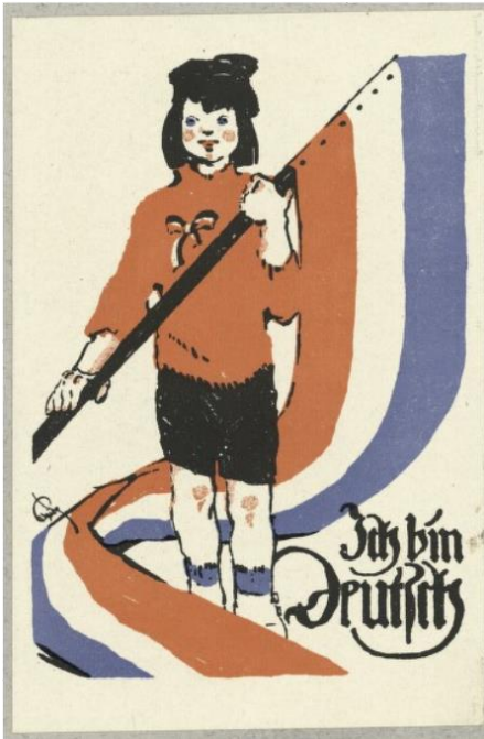
Ich bin deutsch (Jeg er tysk)