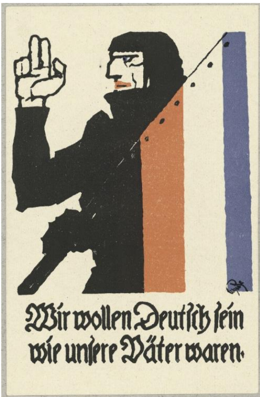
Wir wollen Deutsch sein