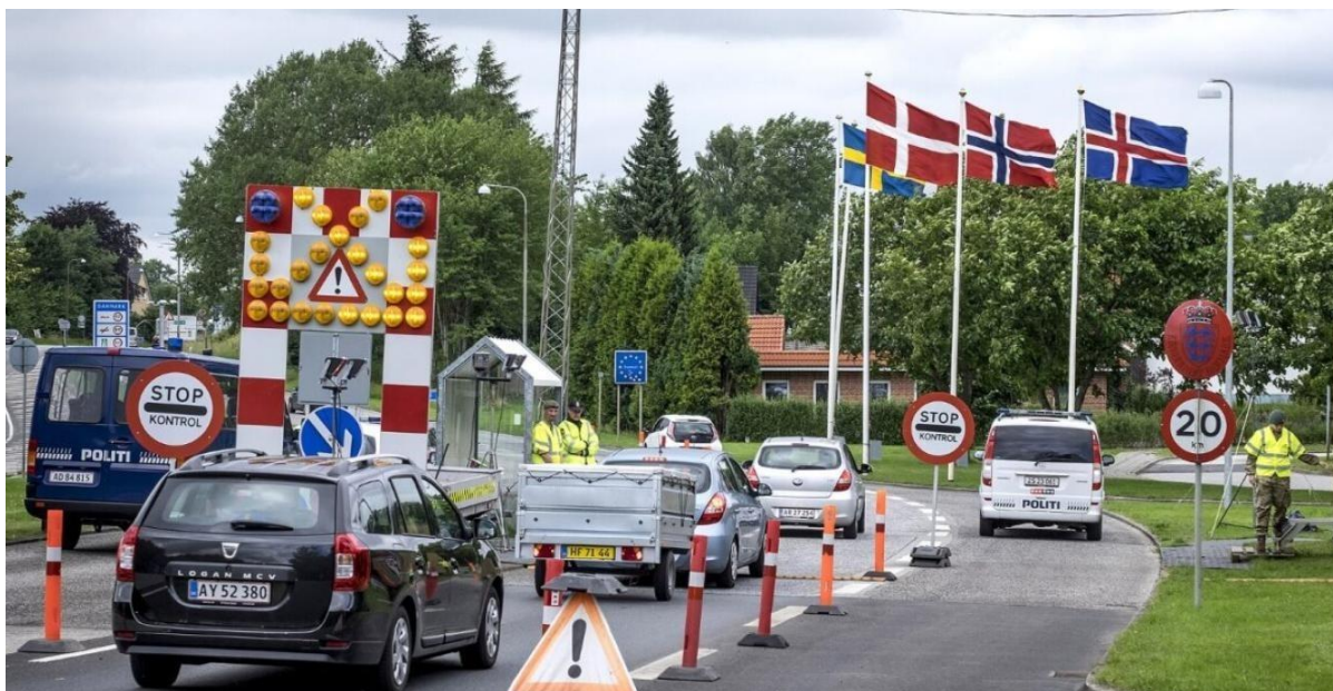
Padborg grænse - som linje