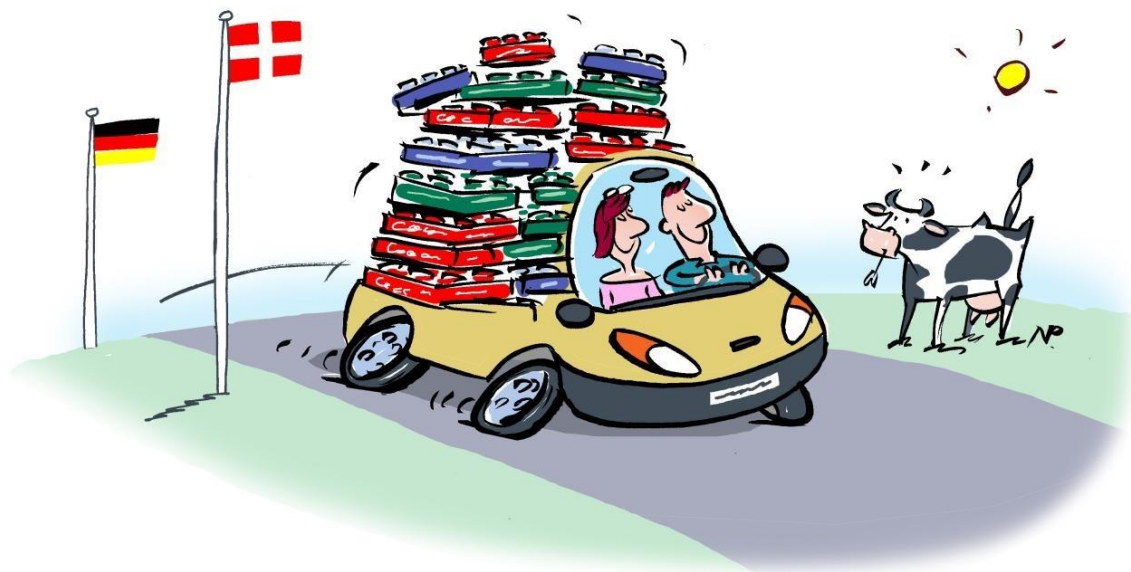
Illustration: Niels Poulsen

Formål: At få kendskab til og blive i stand til at redegøre for sammenhænge mellem den lokale, nationale, regionale, europæiske og globale udvikling, og at opnå indsigt i, hvordan historiefaget kan medvirke til at forstå og løse problemer i nutiden.