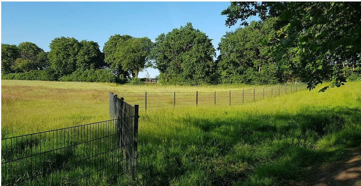
Vildsvinehegnet ved Gendarmstien vest for Rønsdam.

TV SYD: " Grænselivet lever - men én ting havde både danskere og tyskere gerne været foruden ", 2. december 2023.